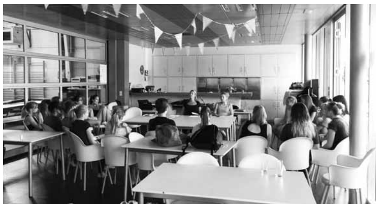
< Onze trainers in opleiding leren elkaar kennen en krijgen hun eerste opleidng.